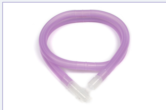
Branche Flextube™ Silver Knight™