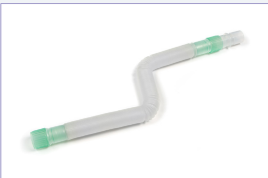
Branche extensible Compact™